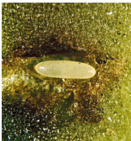
Uovo di B. oleae