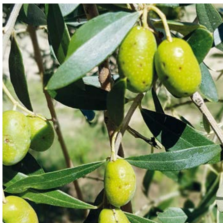
Olive con ferite da ovideposizione causate da femmina di B. oleae

Bactrocera oleae (Diptera Tephritidae), ben nota nel secolo scorso con il nome scientifico di Dacus oleae (Gmelin) e quello comune di daco (da cui infestazione dacica), è da sempre in tutto il bacino del Mediterraneo l'avversità più temuta della produzione olivicola. Polivoltina con un numero di generazioni variabile in funzione delle condizioni climatiche e della disponibilità di drupe, presenta, nelle aree favorevoli al proprio sviluppo, una dannosità