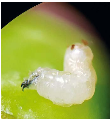
Larva di 3ª età