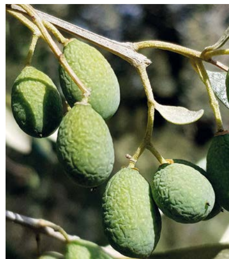
Olive non appetite dalla femmina di B. oleae

Una rapida riflessione sulla valenza dei «sistemi di difesa», a confronto con quella dei «sistemi di controllo» permette di considerare che in termini generali mentre questi ultimi sono perfettamente in linea con i criteri da tempo unanimemente condivisi del concetto di AWPM («Area wide pest management»), non è detto che scontatamente lo siano i primi, i quali invece, almeno nei confronti della mosca delle olive sem-