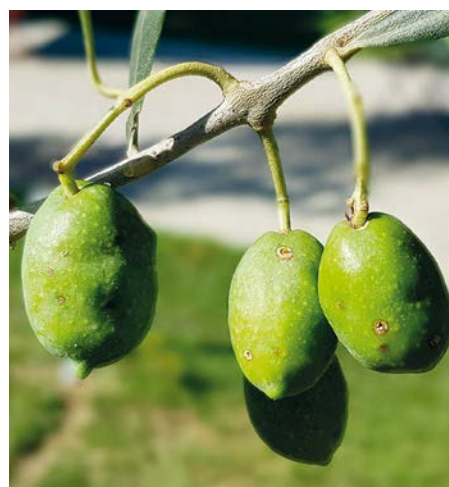
Olive con foro di uscita

superficie dell'oliva (Neuenschwander et al., 1986).