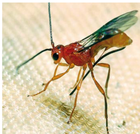
Femmina di Diachasmimorpha longicaudata .

I danni che la mosca è in grado di arrecare partono già dalle ferite di ovideposizione che, anche quando l'uovo viene distrutto dalla larva predatrice di L. berlesiana consentono direttamente, o indirettamente tramite il cecidomide, lo sviluppo di marciume del frutto causato da Botryosphaeria dothidea (più noto forse come Camarosporium dalmaticum ) cui fa di solito seguito la cascola dei frutti colpiti (Bagnoli, 2019). Dall'attività trofica della larva di mosca derivano i danni dovuti alla sottrazione di polpa (fino a superare il 20%) e le non meno significative alterazioni fisico-chimiche e organolettiche della stessa, da cui discendono le perdite qualitative del prodotto finito, olive da mensa o olio che sia. Qualche decennio fa si so-