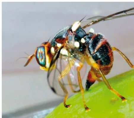
Femmina di B. oleae ovideponente

Quando negli anni 50 l'American Cyanamid brevettò e introdusse nella farmacopea mondiale il dimetoato, la disponibilità di questo nuovo insetticida organico di sintesi fu salutato dai più come un evento epocale di grande ri-