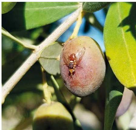
Maschio di B. oleae